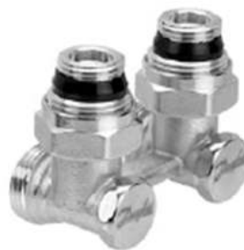
RLV-KS угловой с присоединением к отопительному прибору G ½ и G ¾