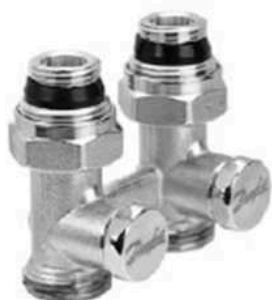
RLV-KS прямой с присоединением к отопительному прибору G ½ и G ¾