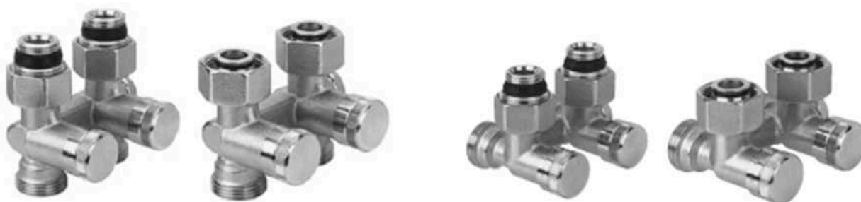
RLV-K прямой с присоединением к отопительному прибору G ½ и G ¾