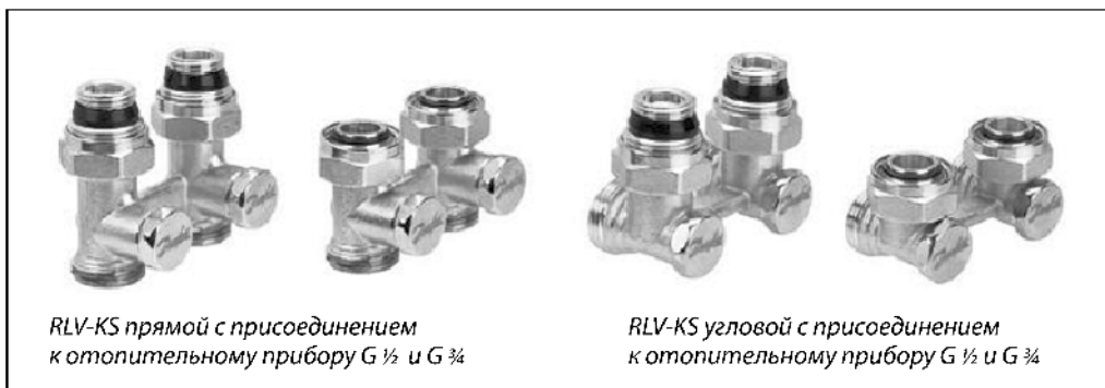
RLV-KS прямой с присоединением к отопительному прибору G ½ и G ¾