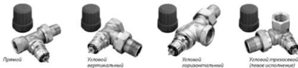
Рисунок - Клапаны терморегулирующие типа RTR-N

Клапаны терморегулирующие типа RTR-N предназначены для применения в двухтрубных насосных системах водяного отопления. Не предназначены для контакта с питьевой водой в системах хозяйственно-питьевого водоснабжения. Клапаны терморегулирующие типа RTR-N оснащены встроенным устройством для предварительной (монтажной) настройки его пропускной способности в рамках следующих диапазонов: